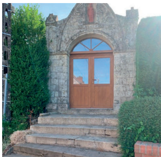
Chapelle saint Rémi

Les travaux de rénovation des chapelles entamés en 2022 se terminent cette année par la rénovation de la Chapelle saint Rémi. La société Patriarca entamera prochainement la pose d'une nouvelle porte, la réparation des marches ainsi que le ravalement de la façade.